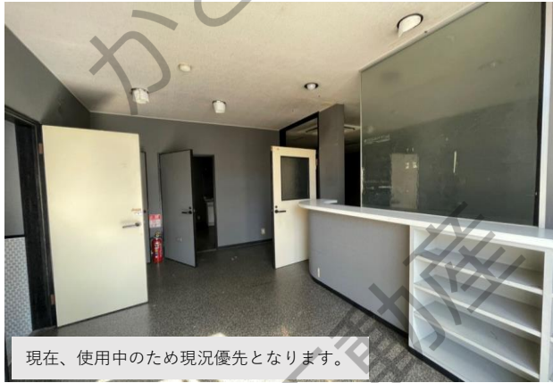
現在、使用中のため現況優先となります。