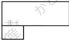
1F 倉庫 275.59m 2 (83.36坪)