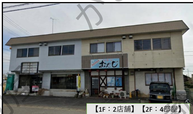
【1F: 2店舗】 【2F: 4部屋】