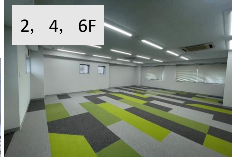
2, 4, 6F

2~6F 1号室 84.88㎡ (25.67坪) 賃料 225,896円 保証金6ヶ月 2~6F 2号室 77.98㎡ (23.58坪) 賃料 207,504円 保証金6ヶ月 2,4,5F 3号室 73.22㎡ (22.14坪) 賃料 194,832円 保証金6ヶ月 6F 603号室 74.14㎡ (22.42坪) 賃料 197,296円 保証金6ヶ月