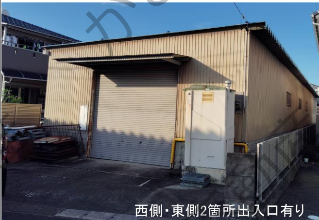
西側・東側2箇所出入口有り