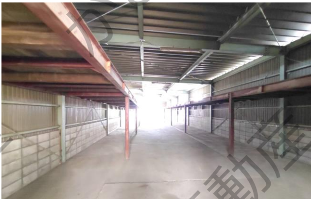
倉庫面積204㎡(61.71坪) 敷地面積299㎡(90.45坪)