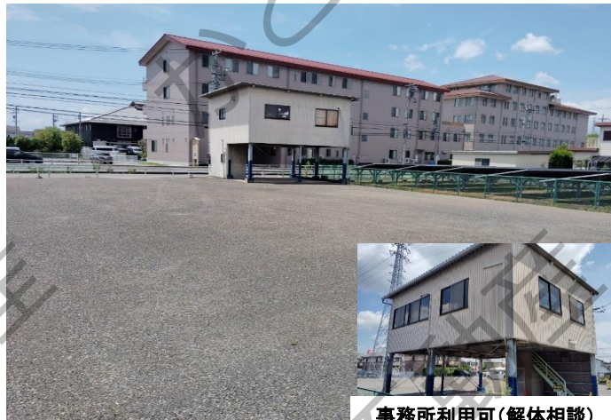
事務所利用可(解体相談)