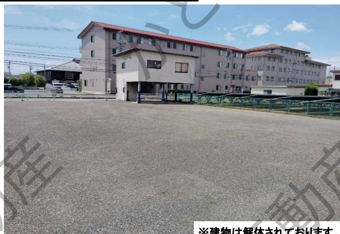
※建物は解体されております。