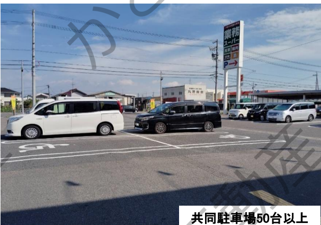
共同駐車場50台以上