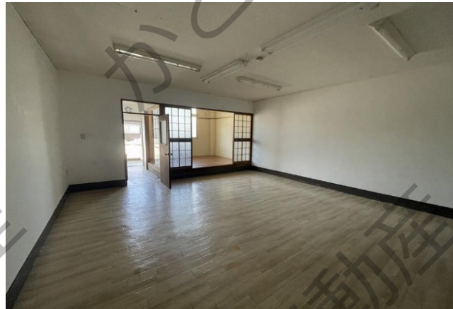
105 貸店舗 38.4㎡(11.6坪)