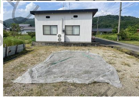
建物南側の土地は月10,000円で賃貸可