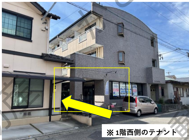
※1階西側のテナント