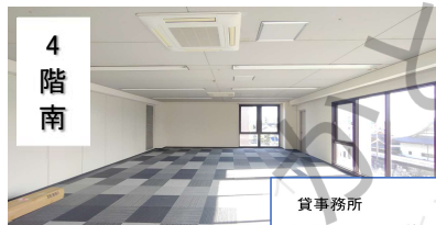
貸事務所 7階 北室145.2㎡(44坪)