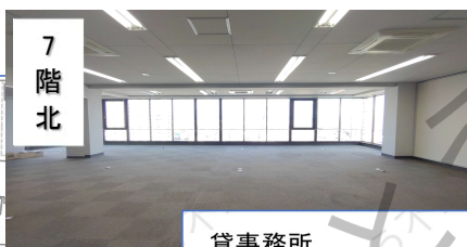
貸事務所 4階 南室76.4㎡(23.15坪)