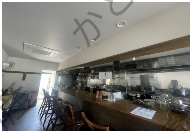
住居付き貸店舗 99.36㎡ (30.05坪)