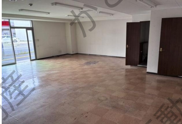
貸店舗(1A号室(1階部分)) 60㎡(18.15坪)