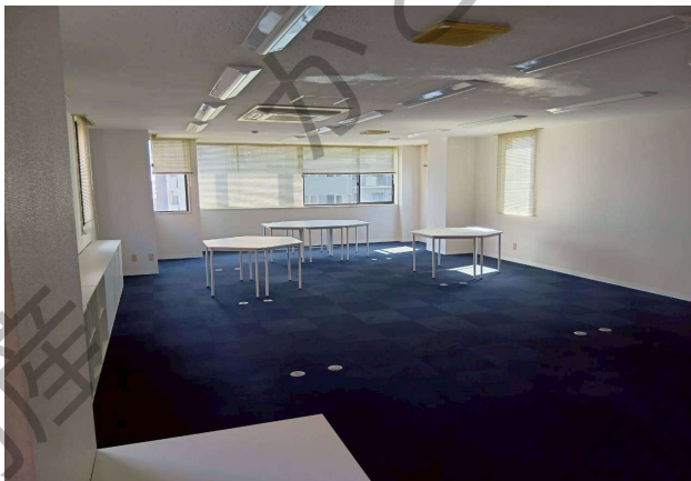
貸店舗・事務所 5F 86.74㎡(26.23坪)