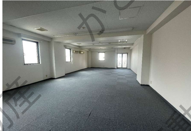
貸事務所 3階 62.6㎡(18.93坪)