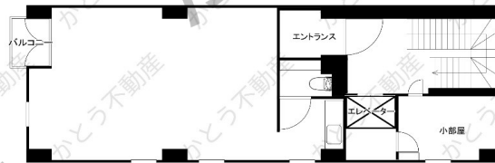
貸事務所 4階 62.6㎡(18.93坪)