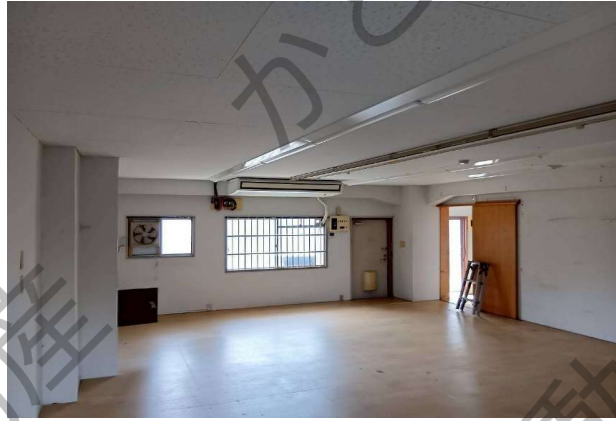
貸店舗・事務所 107、108号室 105.3㎡(31.85坪)