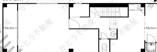
貸事務所 3F 53.70㎡(16.24坪)