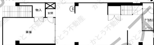
貸事務所 1F 60.00㎡(18.15坪)