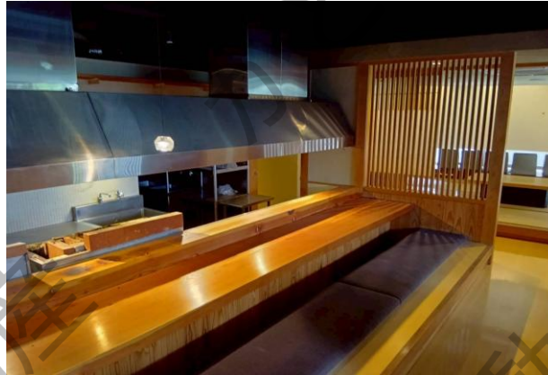
貸店舗・事務所 B1 170.58㎡(51.60坪)