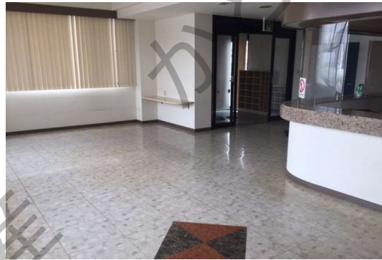
貸店舗 1F 158.49㎡(47.94坪)